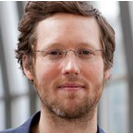
Jan Philipp Albrecht