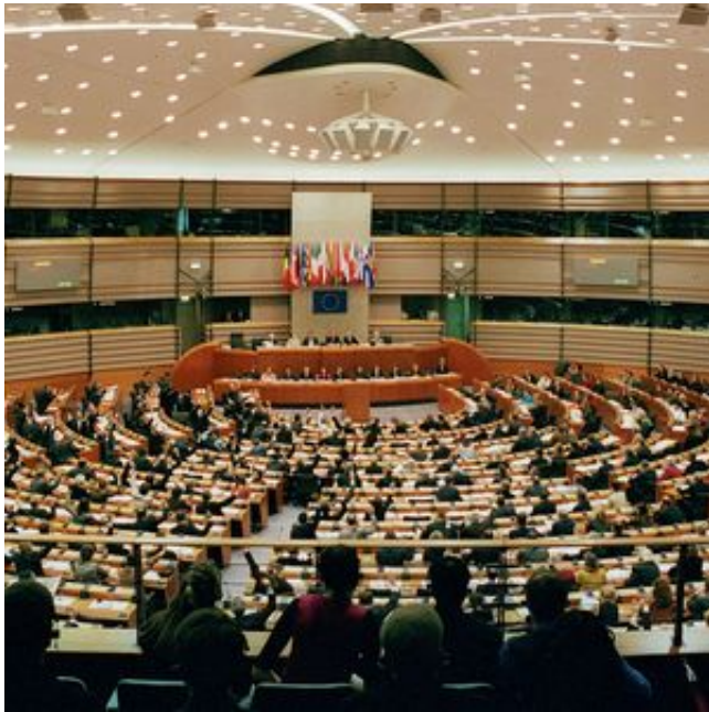
Architecte : Association des architectes du CIC : Vanden Bossche sprl, C.R.V. s.a., CDG sprl, Studiegroep D. Bontinck